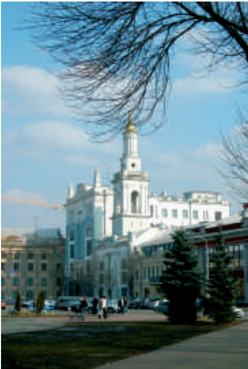
Die herrlichen Kirchen sind ein Reiz von Kiew.