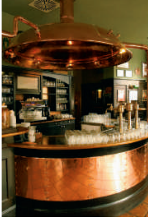
Urige Bierschenken gibt es in Prag noch einige.

Prag war und ist eine der führenden Musikstädte Europas. Was der «Donauwalzer» von Strauss für Wien, ist Bedrich Smetanas symphonische Dichtung «Die Moldau» für Prag. Zwar hat kein anderes Stück der tschechi-