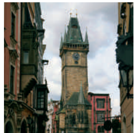
Prag wurde im Zweiten Weltkrieg nie angegriffen und hat deshalb noch viele alte Bauwerke.

Nicht geändert hat sich – zum Glück – die einzigartige Anlage des historischen Stadtkerns links und rechts der Moldau. Die