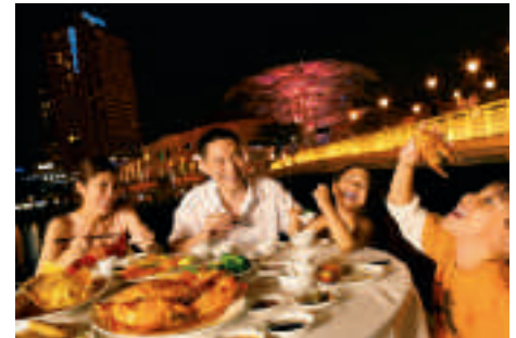
Gourmet-Fans kommen sicher auf ihre Kosten.

Und wenn von sportlichen Highlights die Rede ist, Singapur hat eine eigene Interpretation gefunden: Essen ist der Volkssport