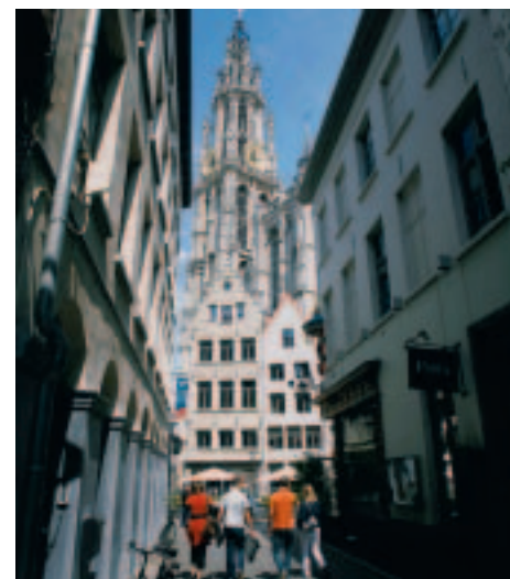
Dominante Sehenswürdigkeit: die Kathedrale.

T ouristisch gesehen spielt Antwerpen mit seinen rund 470 000 Einwohnern, am breiten Scheldel-Fluss gelegen, zumindest bei den Städtereisen im Schweizer Markt höchstens die zweite Geige. Zu unrecht, wie sich der Schreibende überzeugen konnte. Die nach Brüssel grösste belgische Stadt mit dem viertgrössten Hafen der Welt präsentiert sich in diesen Tagen als gleichermassen attraktiver wie dynamischer Ort, in dem die wichtigsten Sehenswürdigkeiten in Fussdistanz zu erreichen sind. Als Ausgangspunkt für den Erstbesucher empfiehlt sich der «Grote Markt» mit dem eindrucksvollen Rathaus, der ebenso imposanten Kathedrale und einigen Zunfthäusern. Das historische Ensemble erinnert an den Grand Place von Brüssel. Nördlich des «Grote Markts» befindet sich die städtebaulich interessanteste Entwicklung Antwerpens. Der Stadtteil ist als das 172 Hektaren kleine «Het Eilandje» bekannt, das Inselchen also. Napoleon hat hier vor gut 200 Jahren Docks angelegt, um England anzugreifen. An dieser Stelle entsteht nun das «Museum aan de Stroom», das über 50 Millionen Euro kostet und 2010 eröffnen soll