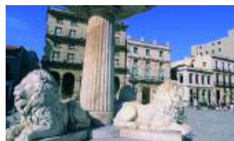
In der Altstadt Havannas breiten sich mehrere lauschige Plazas aus.

Ob das auch die Bevölkerung so sieht, steht freilich auf einem anderen Blatt geschrieben. Viele der gut elf Millionen Kubaner auf der Insel mit ihren 300 natürlichen Stränden sind nach 1959 geboren und kennen nichts anderes als die Revolution unter dem mittlerweile schwer erkrankten, über 80-jähri-