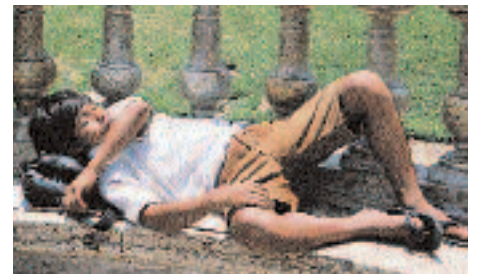
Zeit für eine Siesta mitten im Zentrum von Lima.

Trotzdem lieben die meisten Limeños, wie sich die Einwohner Limas nennen, ihre Stadt. Sie hat sich in den letzten zehn Jahren in eine relativ sichere, am Boden saubere und für den Besucher erstaunlich geordnete Metropole verwandelt. Heute zeigt sich Lima am Plaza Mayor, im Herzen der Altstadt, schon fast wie im Bilderbuch mit bewässerten Blumenbeeten und Palmenalleen, sauber geputzten Fassaden des Präsidentenpalastes oder dem leuchtenden Gelb der mächtigen Kathedrale aus der spanischen