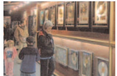
Die goldenen Schallplatten von Elvis Presley können in der «Hall of Gold» auf dem bei Memphis gelegenen Graceland bewundert werden.

Elvis Presley, der «King of Rock 'n' Roll», ist unvergessen. Am 16. August 2007 jährt sich