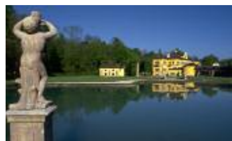
Das Lustschloss Hellbrunn steht für die Tradition in der durch das Salz reich gewordenen Stadt.

Das Museum, direkt am zentralen Mozartplatz, lenkt auf die Salzburger Altstadt, welche Tourismus Salzburg nicht ganz unbe-