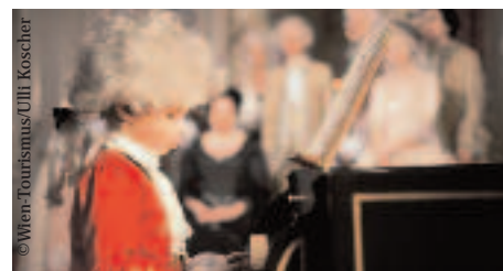
An Mozart führt dieses Jahr in Österreichs Hauptstadt (fast) kein Weg vorbei.