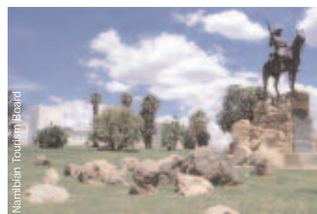
Das Reiterdenkmal und die Alte Feste.

Die Kolonialherren aus Deutschland haben das Erscheinungsbild der Hauptstadt Namibias massgebend geprägt. Fast alle in gängigen Reiseführern als Sehenswürdigkeiten gekennzeichneten Gebäude und Denkmäler stammen aus der Zeit zwischen 1884 und 1920. So auch die bekannte Christuskirche (1910), das Reiterdenkmal