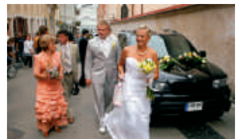
Heiratswillige können in Vilnius unter mehr als 50 Gotteshäusern auswählen.

Die zahlreichen Kirchen locken auch viele Paare an, die hier heiraten. Es ist fast unmöglich, durch Vilnius zu gehen, ohne